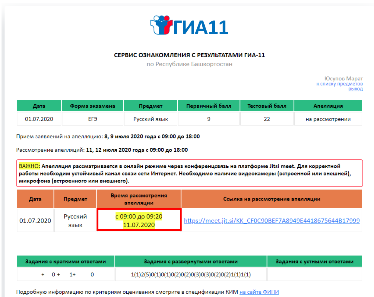
Рисунок 4. Страница «Ваши результаты ЕГЭ» с информацией о времени рассмотрения апелляции с ссылкой на комнату видеоконференции

Поддача и рассмотрение апелляции о несогласии с выставленными баллами проводится в онлайн режиме.